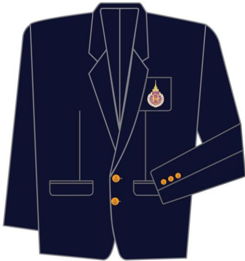
แบบที่ ๑ (ชาย - หญิง)