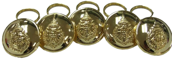
รูปที่ ๒ อินทรรนุ