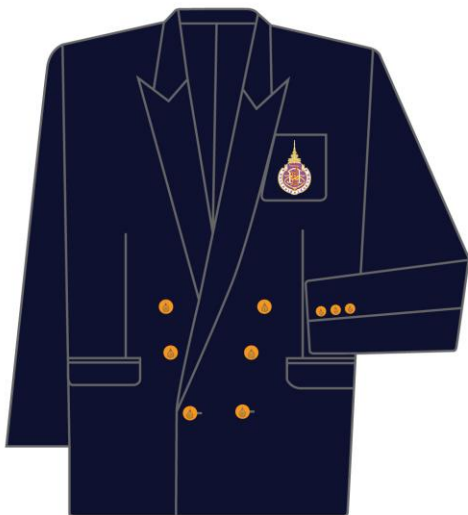
แบบที่ ๓ (ชาย - หญิง)